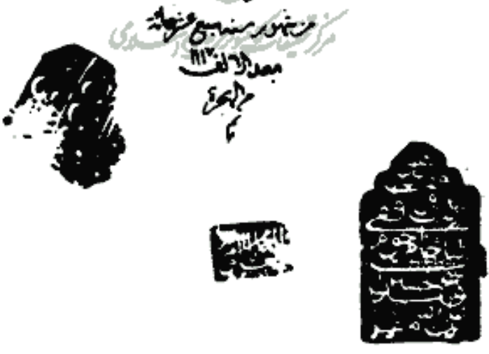
« صورة الصفحة الأخيرة من النسخة ك » « نسخة كربلاء »

وَتَوَكَّلْ عَلَى اللَّهِ وَهُوَ حَسْبُكَ وَاللَّهُ يَتَّبِعُ الَّذِينَ يَدْعُوا إِلَى اللَّهِ وَرَسُولَهُ وَيَخُفُونَ أَنْ يَكُونَ لَهُمْ مِنَ اللَّهِ عِزَّةٌ سَائِغًا وَنُجَاتًا يُرْسِلُ فِي سَمَائِهِمُ السَّحَابَ وَتَلَا مَا نَزَّلْنَا بِالْقُرْآنِ وَنَسِيَ وَأَوَّاهٌ مُنِجٌ وَأَنزَلْنَا الْحُرُوفَ أَجْزَاءً وَتِلْكَ الْأَفْجَادُ الَّتِي نَسَخْنَا مِنْ قَبْلِهَا وَإِنَّا لَنَدْرِ الْأَفْجَادَ وَمِنَ الْأَفْجَادِ الْيَهُودَ وَالنَّصَارَى وَإِنَّمَا كُنَّا لَكُمْ فِتْنَةً أَنتُمْ أَكْثَرُ عَلَيْكُمْ فَذَكِّرُوا أَنْتُمْ نَفْسَكُمُ الْيَوْمَ إِنَّا كَارِهِمْ أَن يَزِيدُوا فِي كُفْرِهِمْ وَلَهُمْ عَذَابٌ عَظِيمٌ وَمِنَ الْأَفْجَادِ الَّذِينَ آمَنُوا وَالَّذِينَ هُمْ يُرْسِلُ فِي سَمَائِهِمُ السَّحَابَ وَتِلْكَ الْأَفْجَادُ الَّتِي نَسَخْنَا مِنْ قَبْلِهَا وَإِنَّا لَنَدْرِ الْأَفْجَادَ